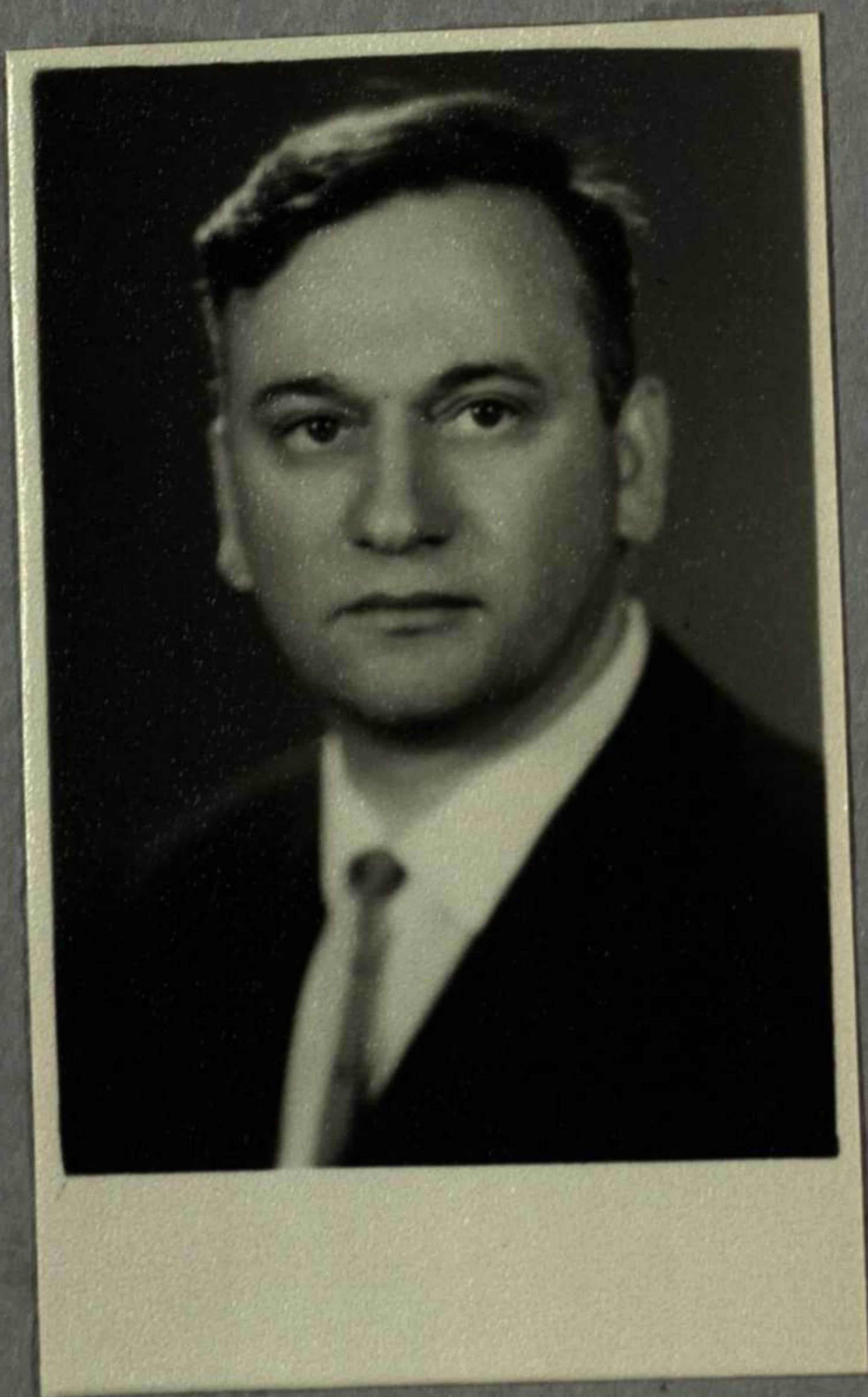
Z. Gegeckas dirbo nuo 1964 m.

Šiaurės Lietuvoje, tame derlingų lygumų krašte, švyti Joniškėlis. Jį tai vienu, tai kitu metu