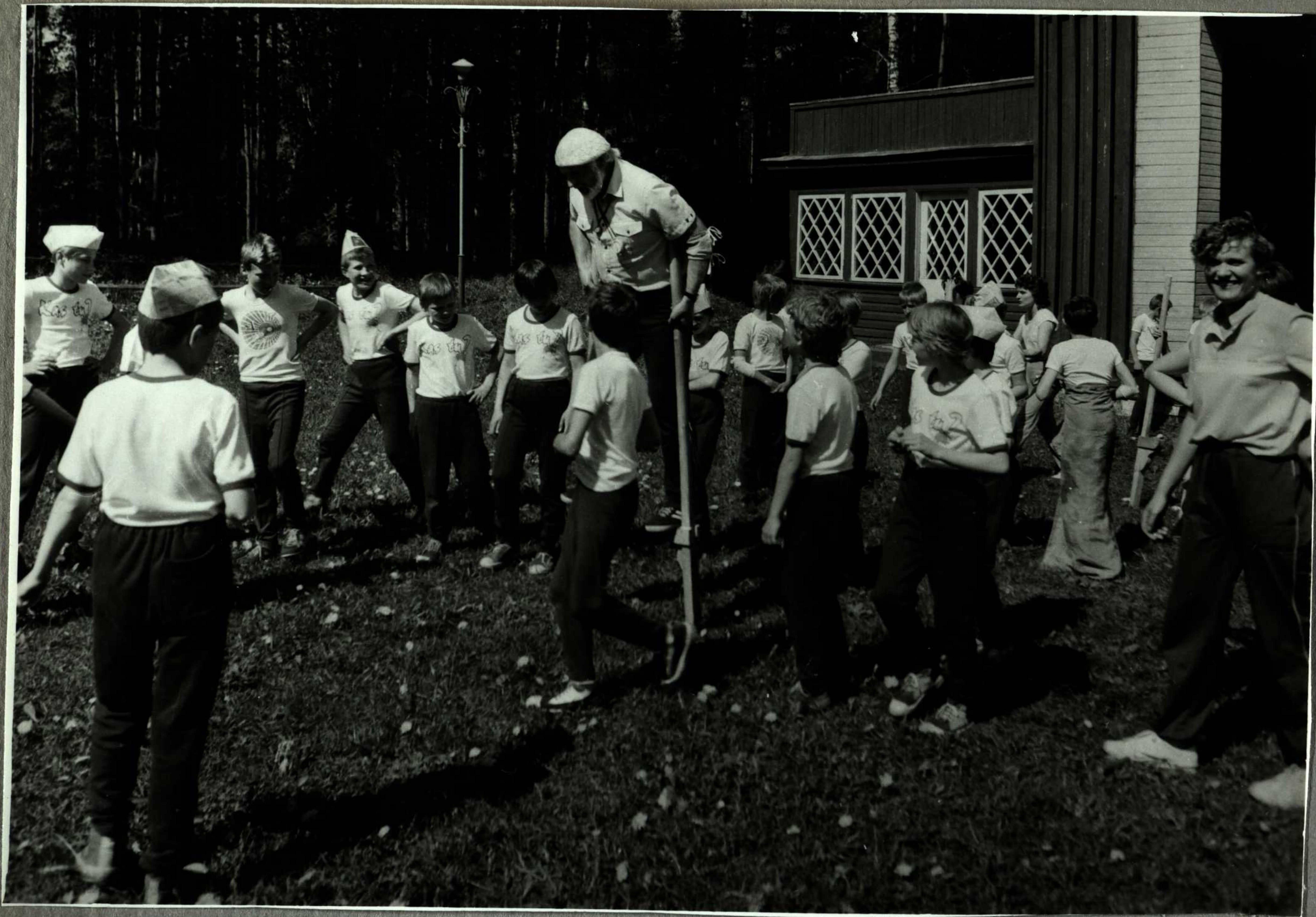
Tr turistiniame žygysje