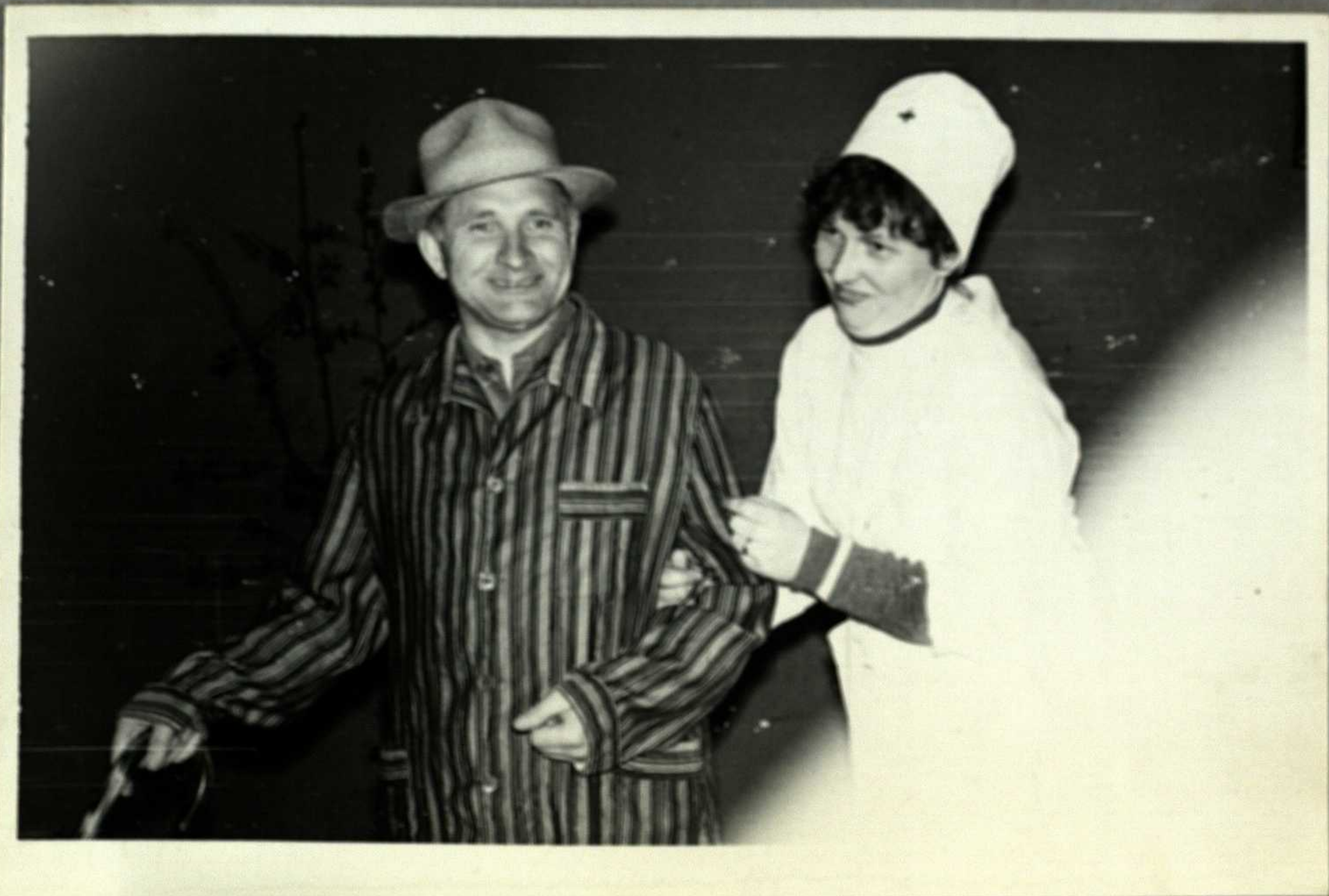
O štai ir ji pati