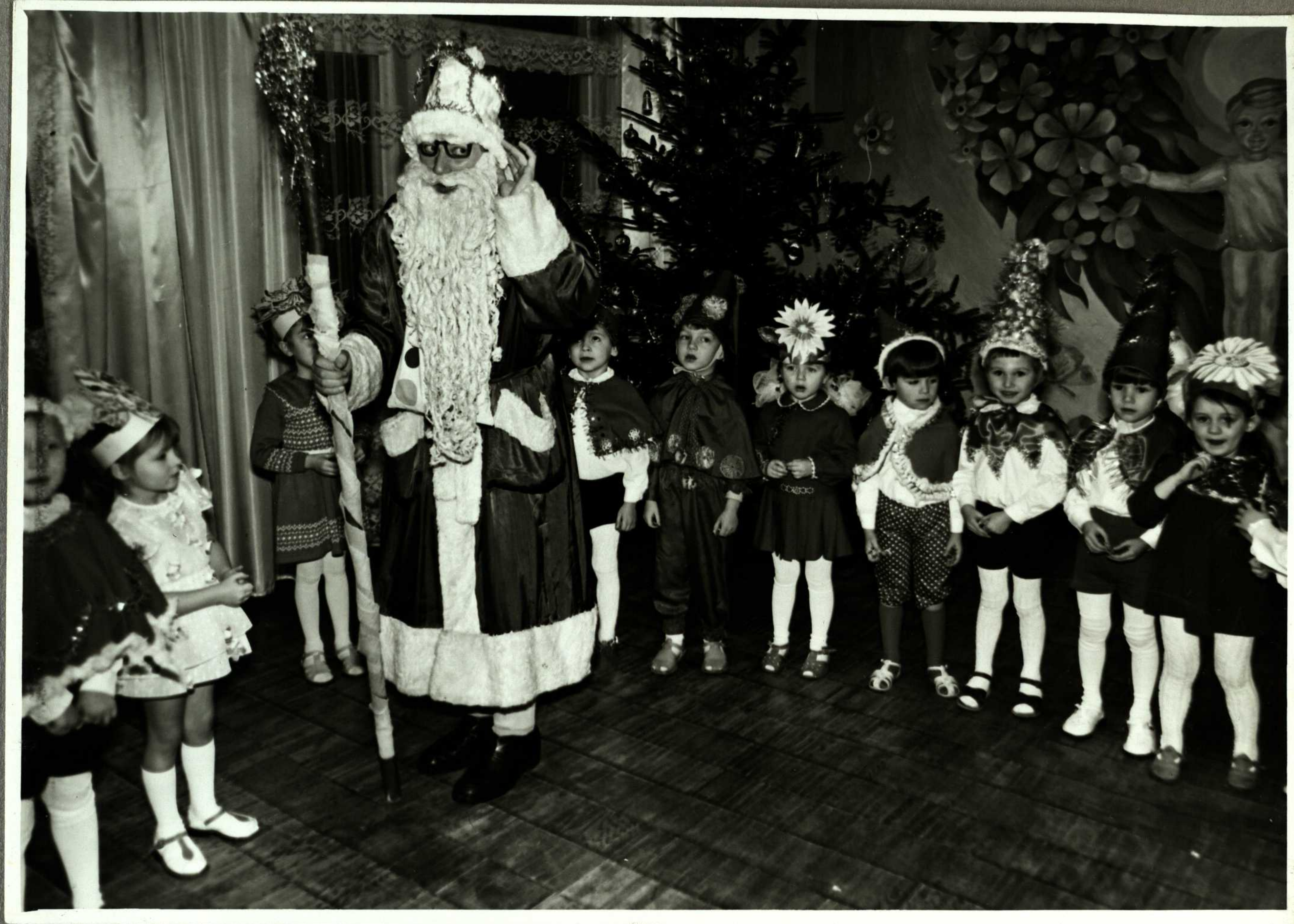
Tr pnie eglutės