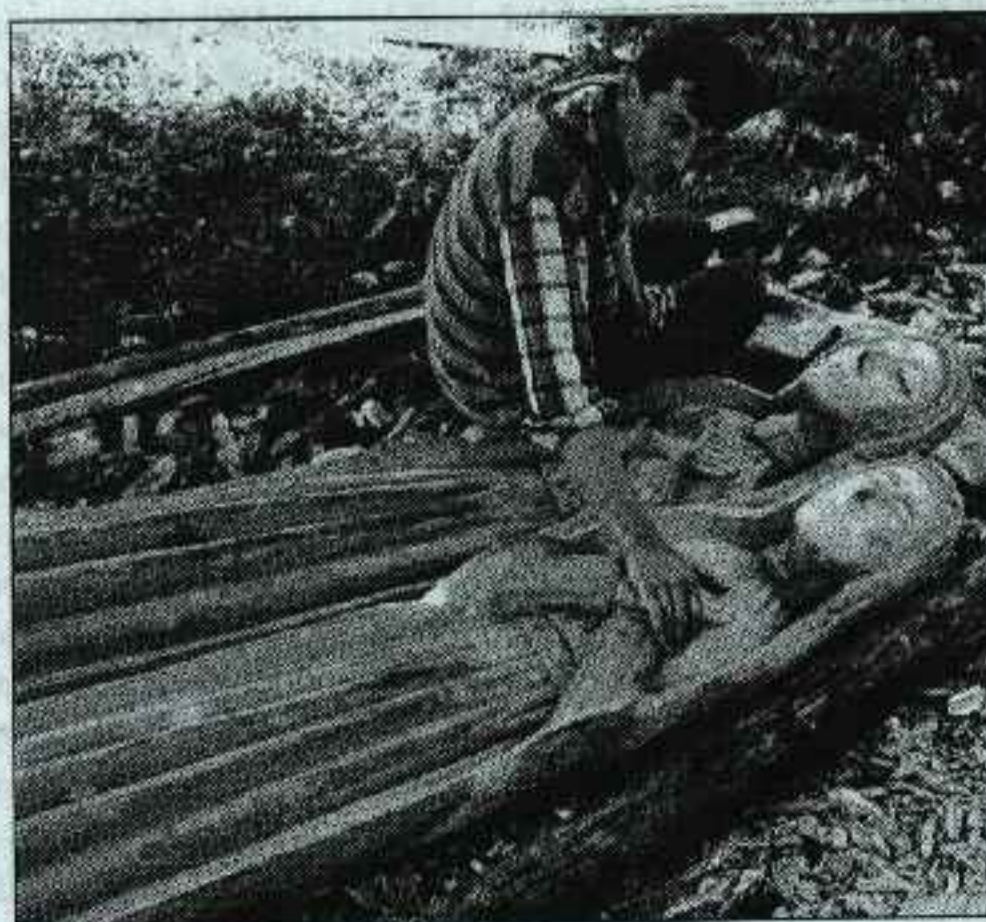
Autorius prie kuriamo Tetirvinių kryžiaus "Išėjusiems".