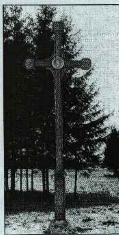
Padėkos norvegams kryžius.