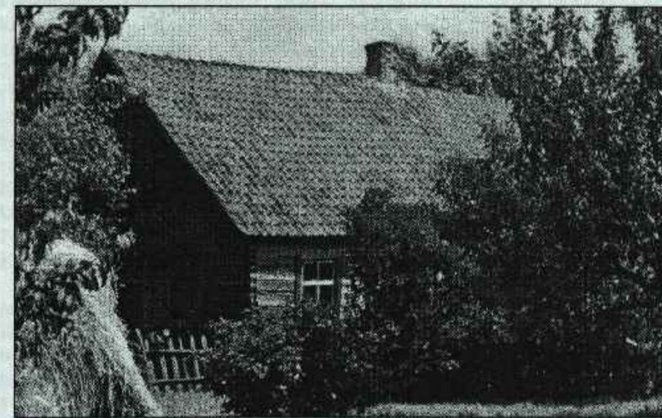
B. Grigelionio gimtasis namas Ičiūnuose. Nugriautas 1973 m.

Bet geriausiai prisimenu dviejų galų su stiklo gonkomis gyvenamąjį namą: viename gale gryčia su kamaromis, kitame - seklyčia su keliais kambarėliais.