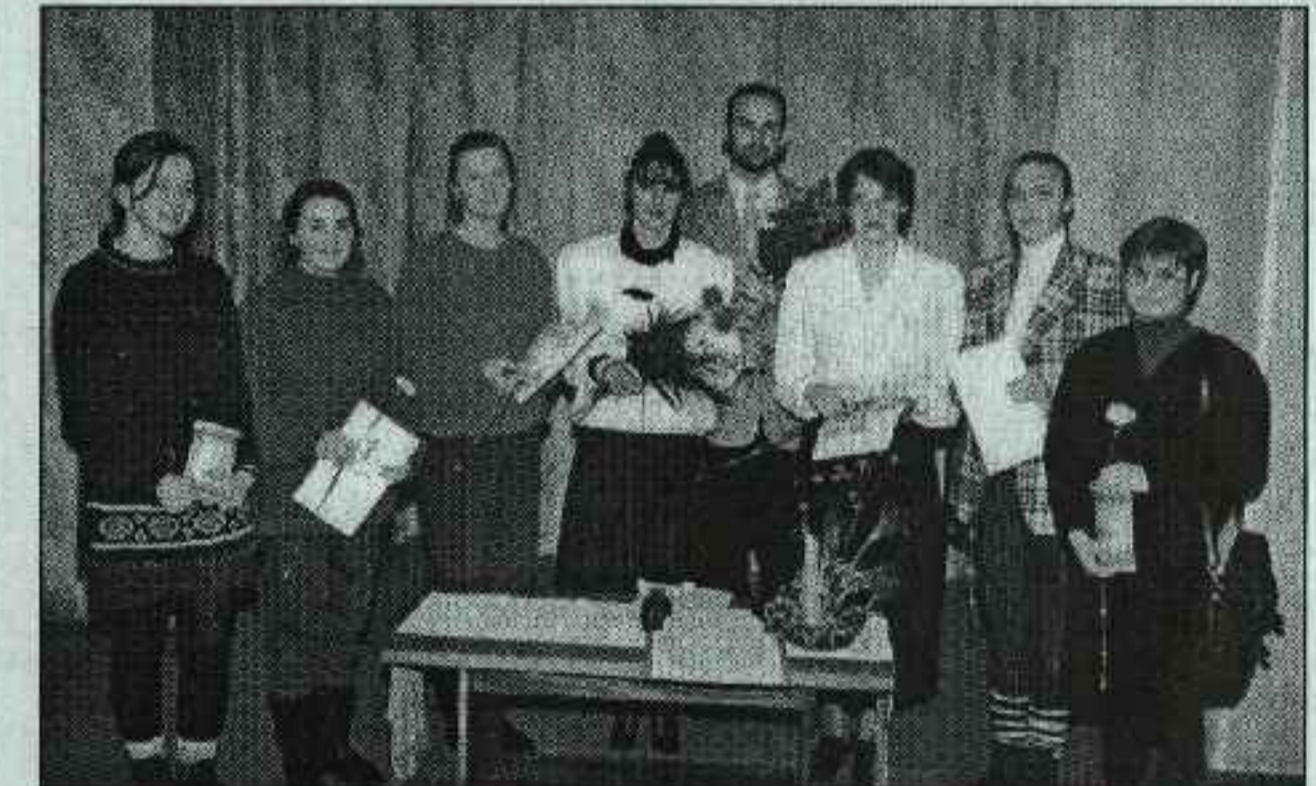
Po pirmojo konkurso.