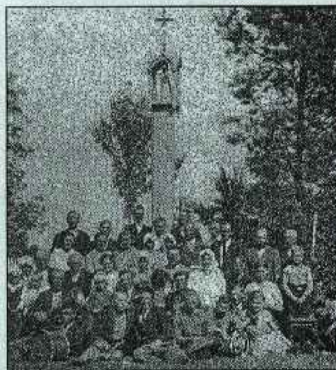
Knygnešio P. Šembelio kieme po kopyltulpio pastatymo 1935 m.